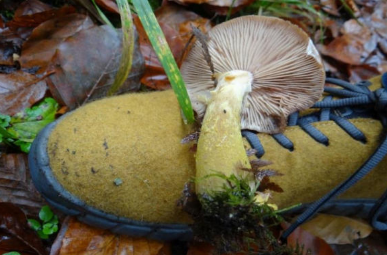
Hallimasch ( Armillaria spec. ), Foto: Thomas Kalveram