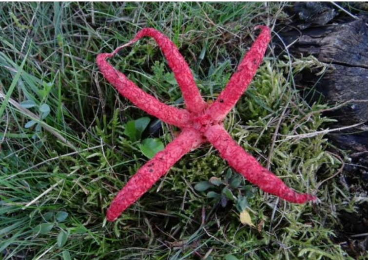
Tintenfischpilz ( Clathrus archeri ), Foto: Thomas Kalveram