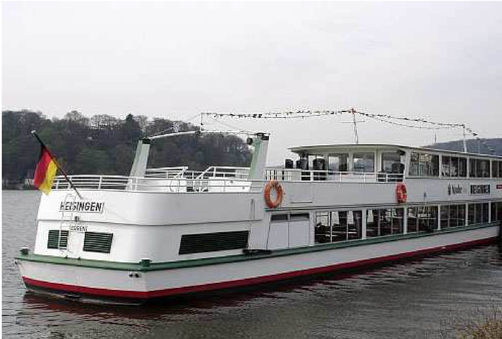
MS Heisingen, Länge 38 m