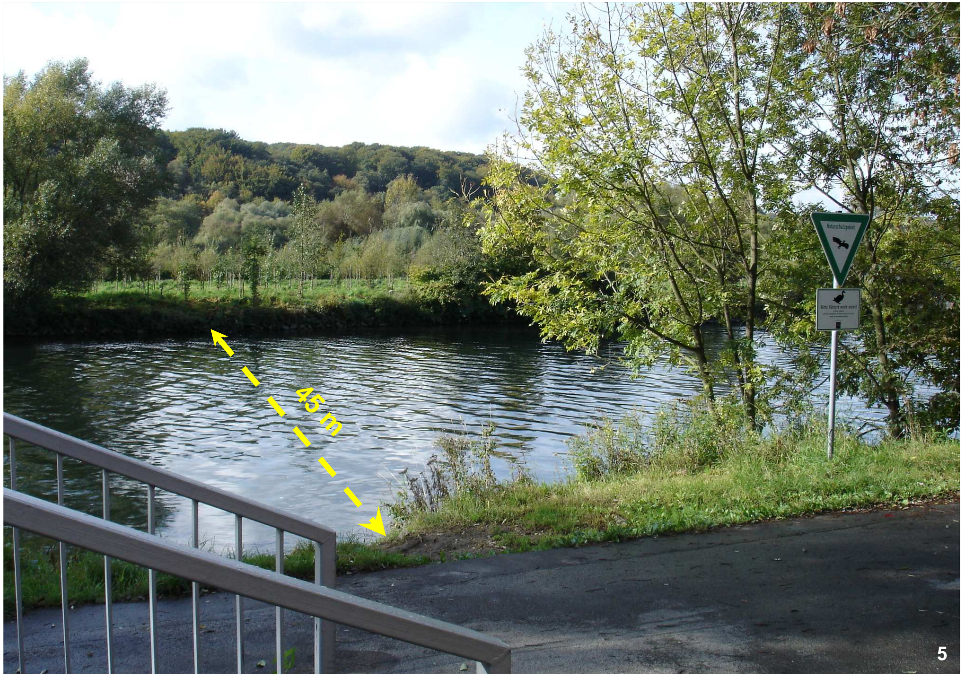
Geplante Anlegestelle in der Heisinger Aue am S-Bhf. Essen-Holthausen